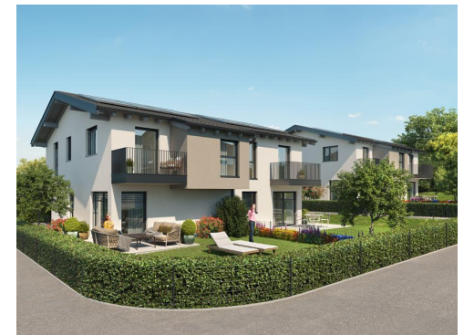
HAUS H - G

Leben - Lieben - Landschaft Lamprechtshausen