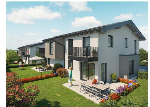
HAUS A - B

Leben - Lieben - Landschaft Lamprechtshausen